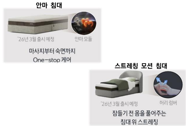
그림3 코웨이 혁신 기술 침대(2026년 출시 예정)