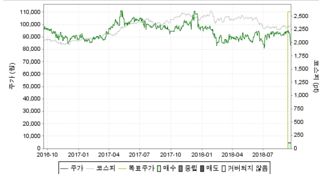
— 주가 — 코스피 — 목표주가 □ 매수 ■ 중립 ■ 매도 □ 커버되지 않음